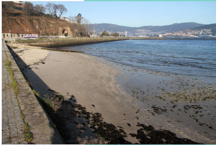
4-Praia da ETEA