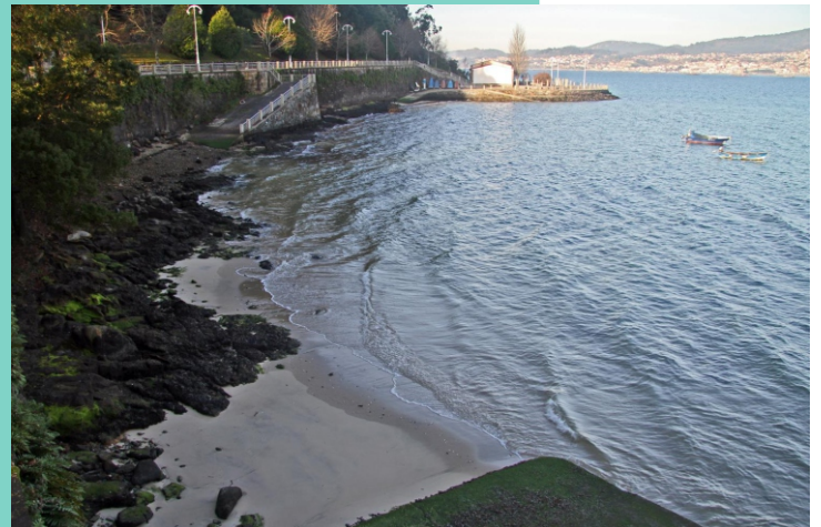
6-Praia e punta da Guía.