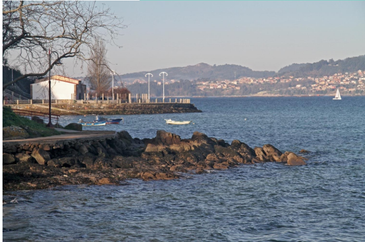
6-Praia e punta da Guía