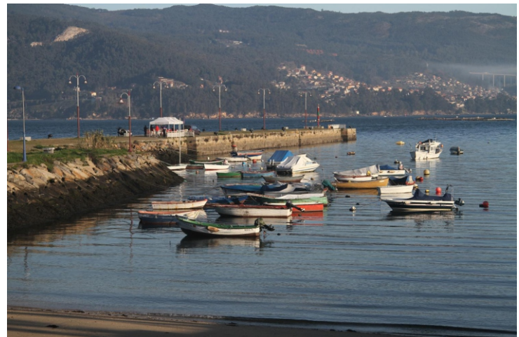
3-Porto de Teis

A beira do mar de Teis (Vigo), nas zonas que non están ocupadas por instalacións industriais e portuarias e na contorna do monte da Guía, aínda conserva espazos sen transformar nos que se acollen abrigos para embarcacións menores e pequenos areais, espazos para o lecer para as persoas das proximidades.