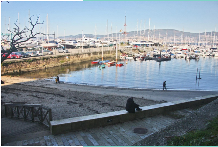
Praia da Lagoa