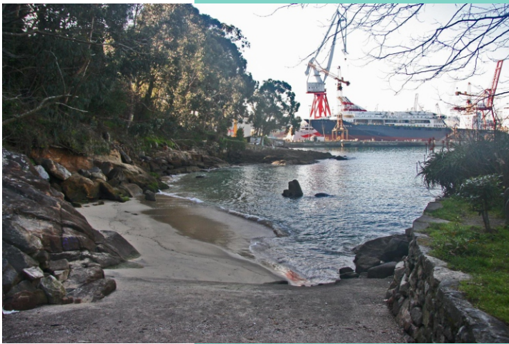
Praia de Manquiña