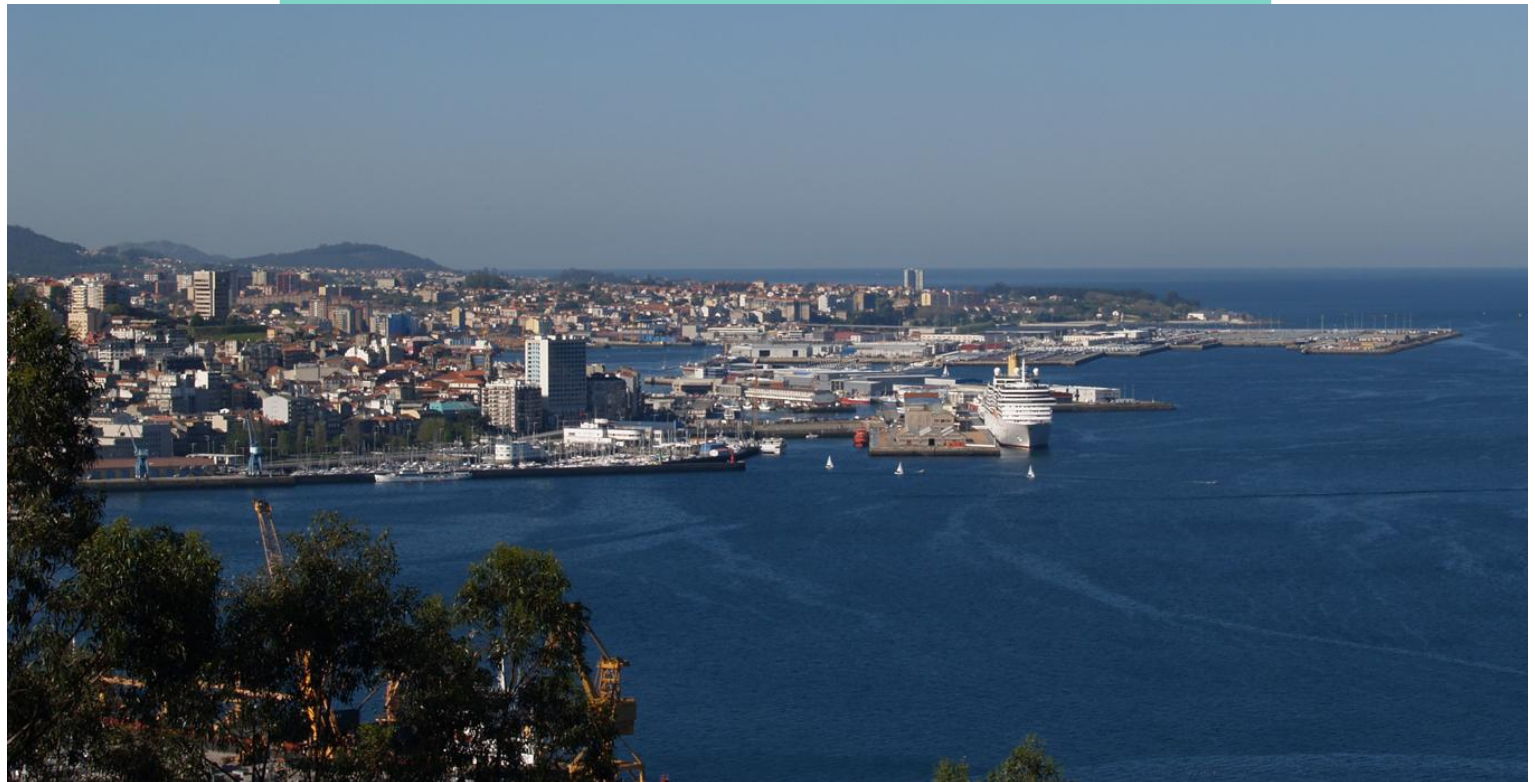
Vigo desde a Guía