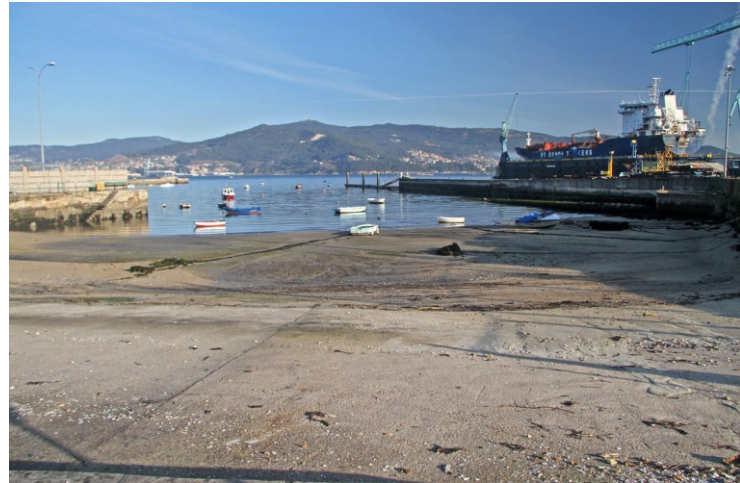
Praia de Ríos.