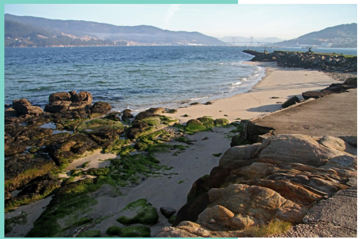
5-Praia e punta de Areiño