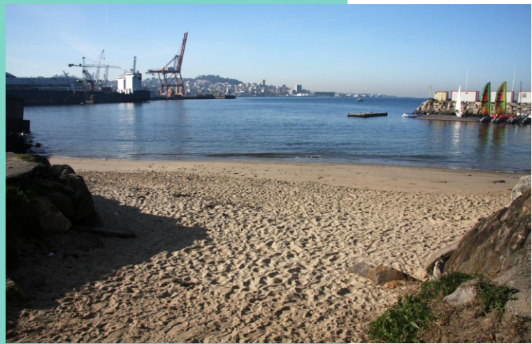
9-Praia da Fábrica