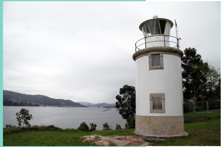
Faro da Guía