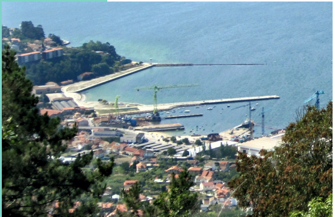
Litoral de Teis

Se queremos aproveitar para contemplar unha boas panorámicas de Vigo e da ría podemos subir ata o miradoiro do cume da Guía .